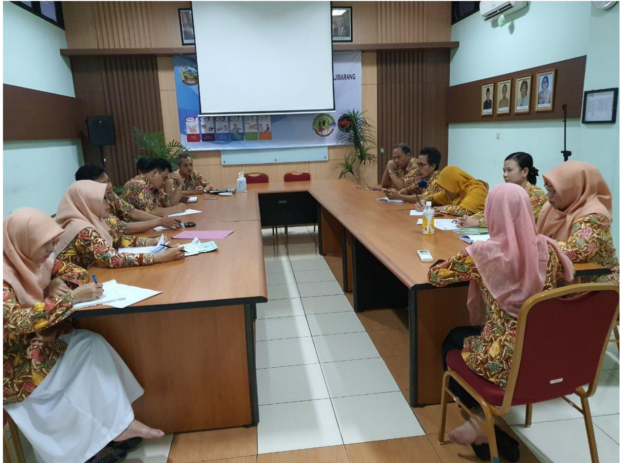
EVALUASI HASIL SKM TRIMESTER IV